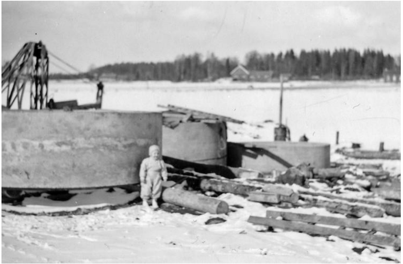
Från Hästefjordens invallning 1955.