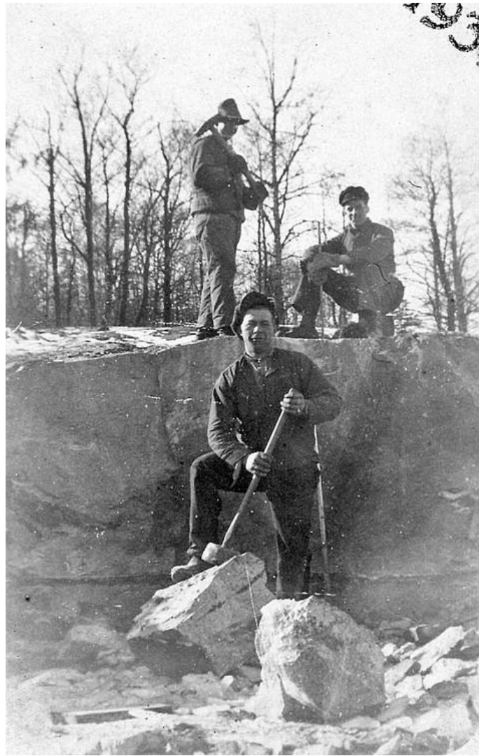
Arbetare i stenbrott vid Hästefjord. Troligen vägbygge i början av 1930-talet.