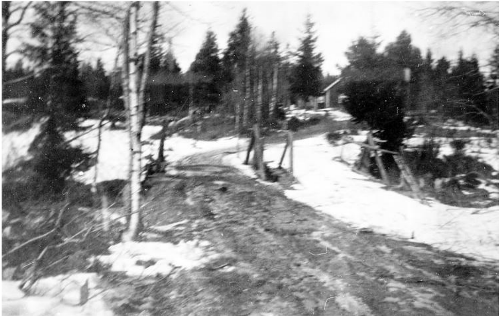
P.g.a. osämja byggdes två broar över Futtonkanalen. Foto från början av 1930-talet.