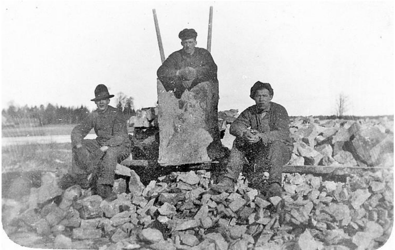
Troligen vägarbete på Hästefjord vid anläggning av vägen Rösebo-Åbro Lia, i början av 1930-talet.