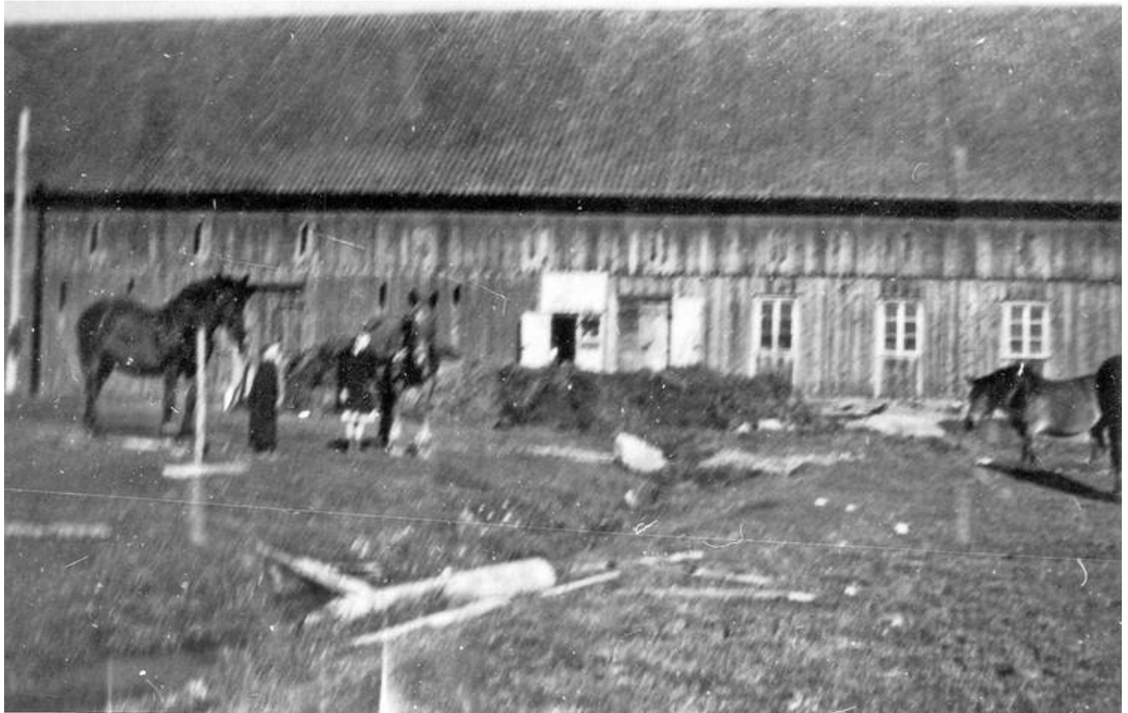
Den stora ladugården på Sundsholm som byggdes av Kock. Ladugården brann ned 1950.