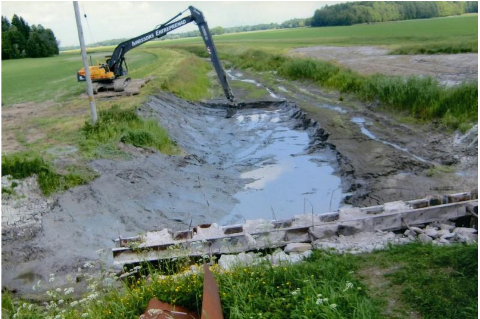
Rensning av invallningskanal vid Hästefjord nr 1. Ivarssons entreprenad gräver.