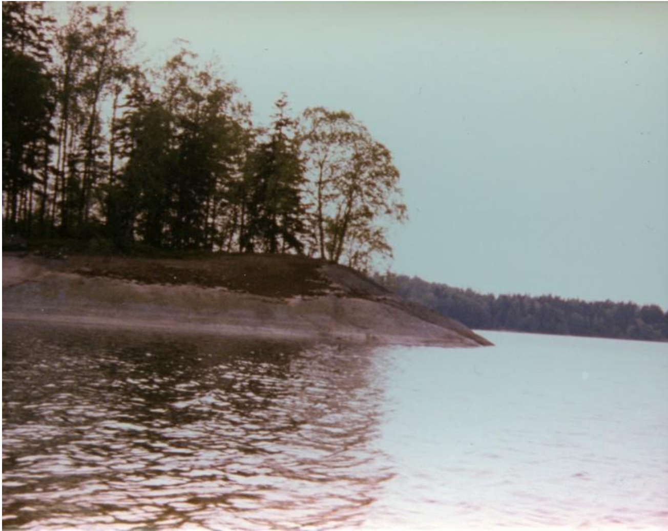
Korpön i Hästefjorden.