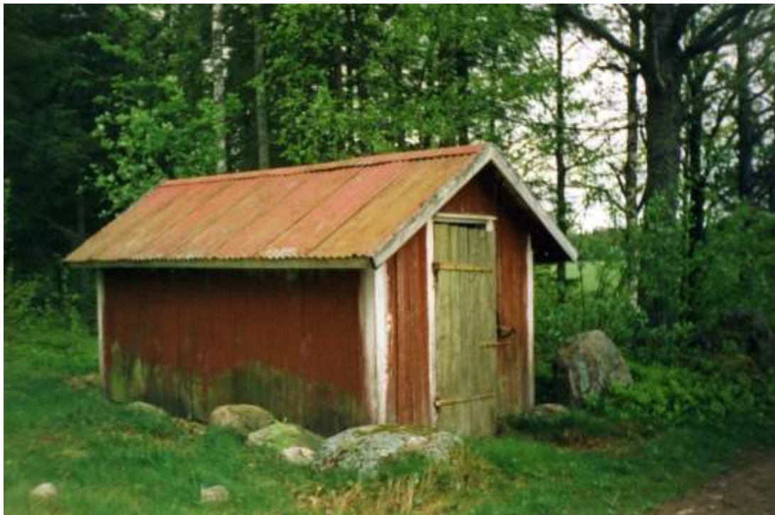
Posthuset i Binäs.